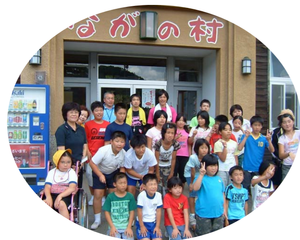
走島小学校職員一同

先日の私たちの合宿の際には、たくさんのお力添えを誠にありがとうございました。海の子どもたちにとって、これまでしたこのない数々の体験をさせていただき、帰ってきた子どもたちは「まわりも、二まわりもたくましく成長したように思います。」